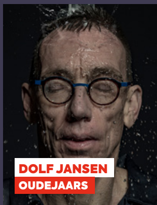
DOLF JANSEN OUDEJAARS

Een jaar dat begon met stormen, bosbranden, een wereldwijd virus EN het verdwijnen van de dagelijkse "aan tafel!" van DWDD... hoe ga je daar in naam van een God naar keuze nog een fijne vrolijke voorstelling van fabrieken? Voor Dolf Jansen is dat een retorische vraag in zijn 31e (!) oudejaarsvoorstelling.